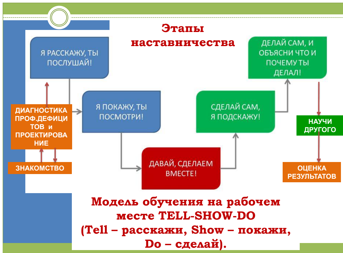
Рисунок – 1 Этапы наставничества