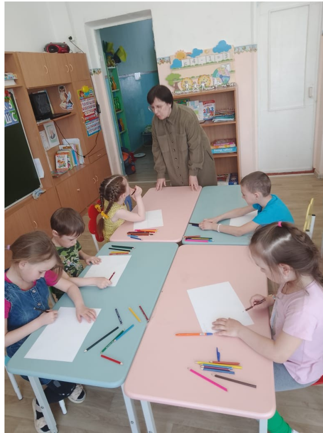
Рисунок "Что мне нравится в школе"