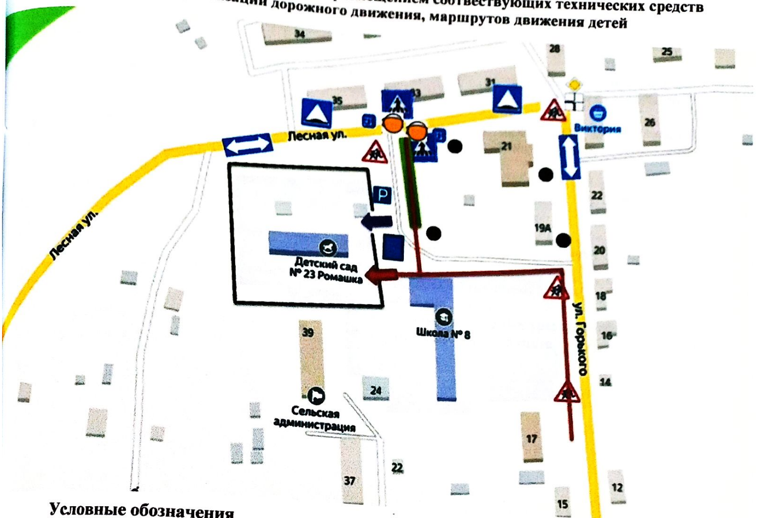
СХЕМА № 2. Организация дорожного движения в непосредственной близости от образовательного учреждения с размещением соответствующих технических средств организации дорожного движения, маршрутов движения детей