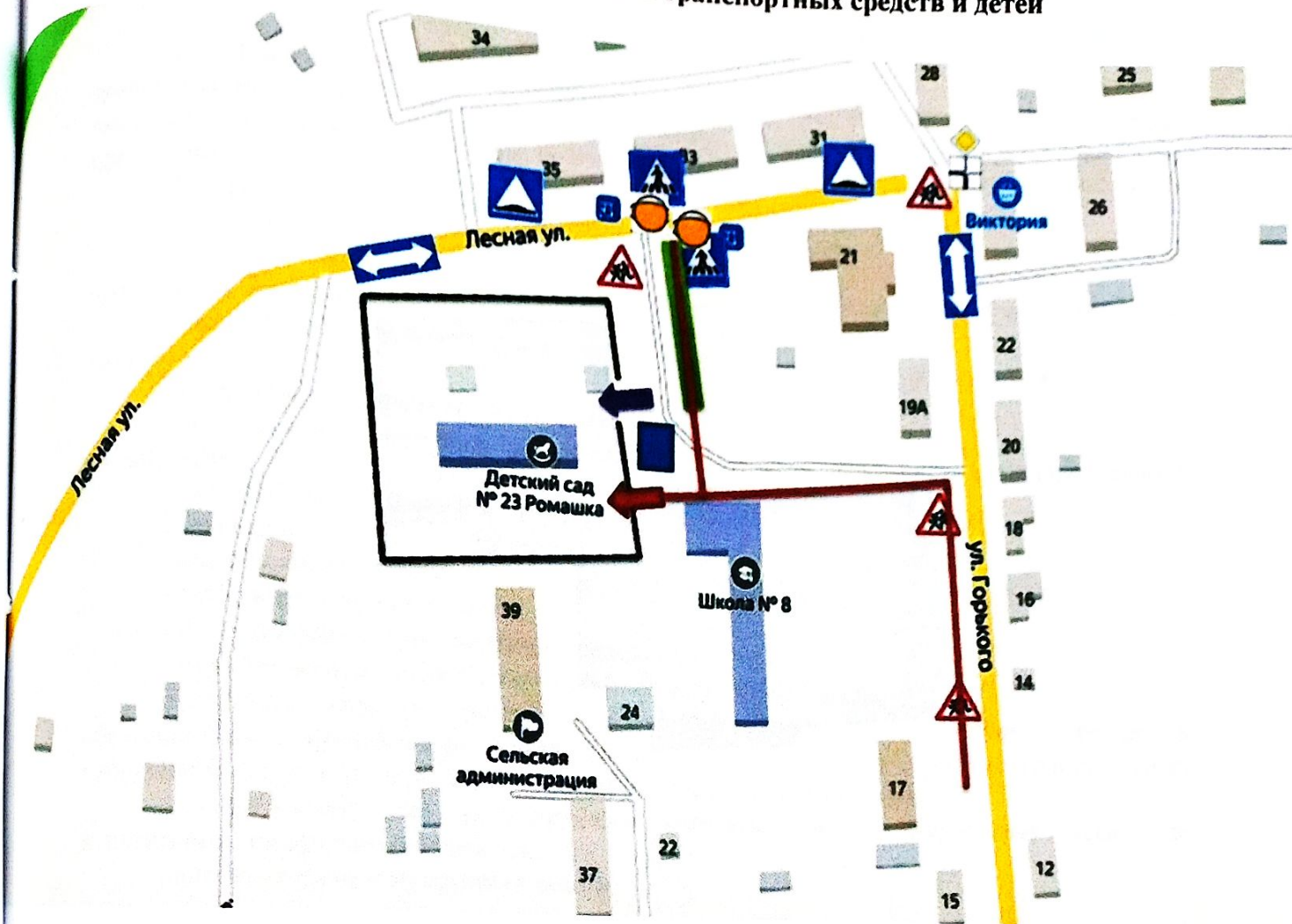
СХЕМА № 1. Район расположения образовательного учреждения МБДОУ № 23 «Ромашка», пути движения транспортных средств и детей